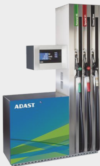
Модификации V-line Major H

Производительность Количество продуктов Количество раздаточных кранов Точность выдачи % Виды топлива Насосный моноблок Измеритель объема Заправочные шланги Раздаточные краны Электроника Калибровка ТРК Вид индикации Материал корпуса Дизайн корпуса Температура эксплуатации Стандартный протокол